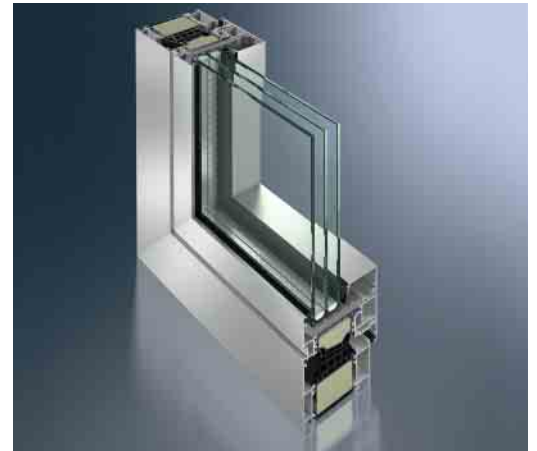
Schüco Fenster AWS 90.SI+ Schüco Window AWS 90.SI+