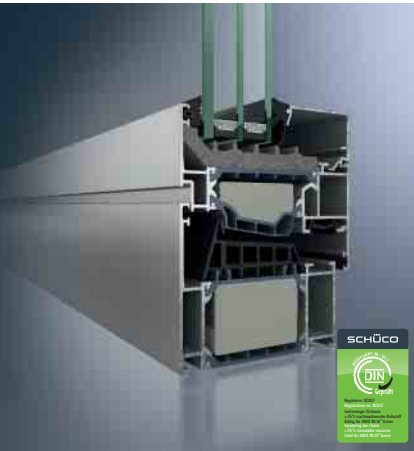
Schüco Fenster AWS 90.SI+ Green Schüco Window AWS 90.SI+ Green